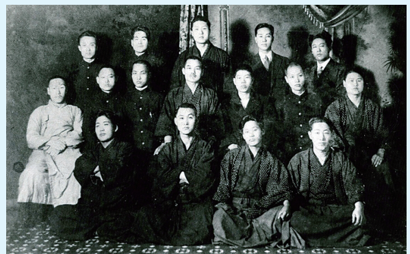
2.8 독립선언의 주역들

‘하나님은 그리스도를 통해 우리를 자기와 화해시키고 우리에게 화해의 직책을 주셨습니다.’ (고린도후서5:18)