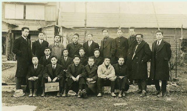
震災で焼失した会館の跡地の前で同時のYMCA会員

「主よ、どうかお救いください。誰一人とり残されずすべての人が人間として、日々この社会に生きる住民として、その尊厳が守られますように。そのために、住民相互の異文化間の交わりがいつそう深められ広められ、法制度を含む社会の仕組みが整えられるようにしてください。特に今日、新型コロナのパンデミックにより、世界中が未曾有の困難な状況に直面しています。困難な状況にあっても、互いの信頼感がますます豊かに育まれますように。主イエス・キリストの御名によってお祈りいたします。アーメン。」(2022年「人権主日礼拝 祈禱文、交読文」より)